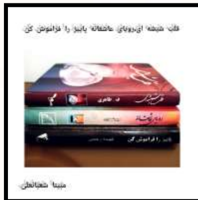
نمونه ای از مشارکت دانش آموزان در مرحله دوم طرح کتابخوانی