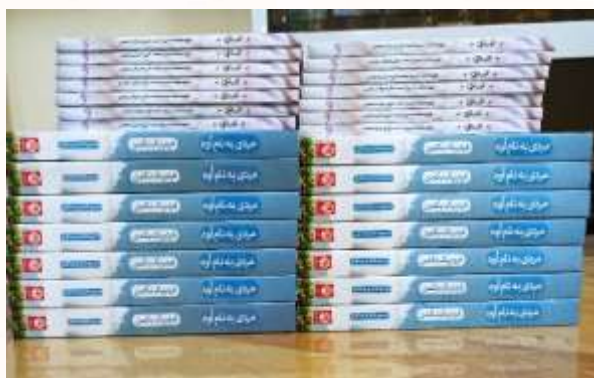
تهیه تعدادی از کتاب ها برای دانش آموزان علاقمند جهت مطالعه و شرکت در طرح کتابخوانی